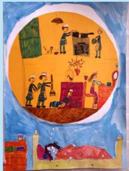
Kiss Luca 3.b

„Furcsa volt, hogy nem kell iskolába mennem. Én osztom be az időmet, hogy melyik tárgygyal foglalkozok és mennyi ideig. Úgy érzem, önállóbbá tesz engem. Érdekesek a tantárgyak, különböző weboldalakat használunk. Az interaktív feladatoknál addig foglalkozhatok a feladattal, míg helyes nem lesz. Hátránya is van: ilyen a technikai eszköz, pl. kicsi a telefon kijelzője, szakadozhat a net. Személyes találkozások, az osztálytársak, közös sportok hiányoznak és a sok bolondozás.”